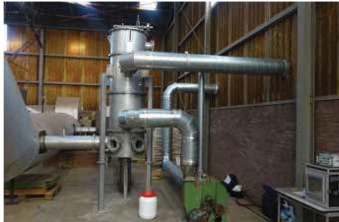
»1 Unit in plant trial at Rodruza Rossum

In the plant trials that lasted twelve months, it was investigated under which conditions